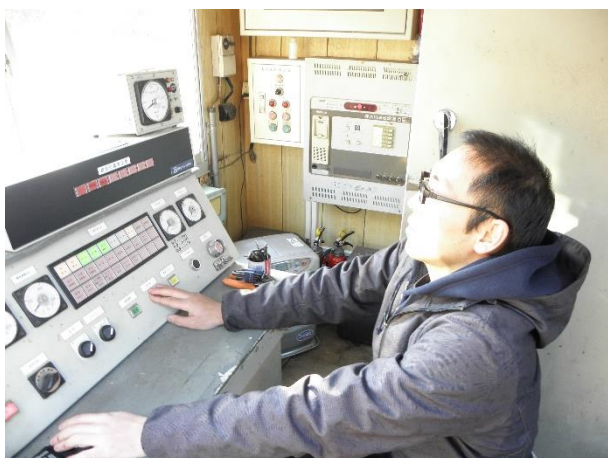
〈 運転および停止操作 指導 〉