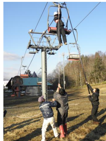
〈 救助訓練 〉