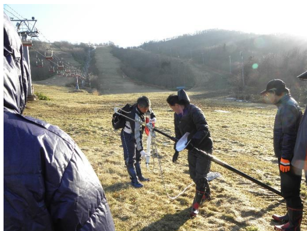
〈 救助用具 取り扱い説明 〉