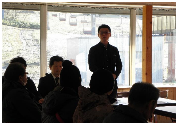
〈 全体研修時 社長より安全について 〉

当社では、輸送や皆さまの安全に役立つよう、シーズン営業開始前に施設及び取扱についての安全教育を実施しています。