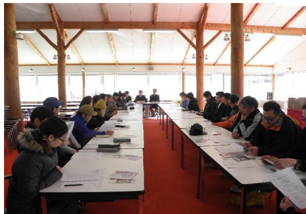
〈 シーズンイン前 全体安全教育研修 〉