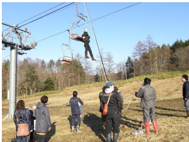
〈 救助訓練 〉